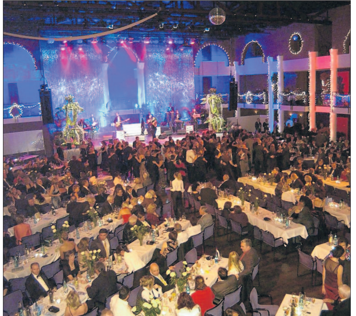
Eine Sinfonie aus Lichterglanz und Glimmer war die Dekoration im großen Saal des Congress-Forums beim Galaball des Sports, der sich durch eine stark ausgeprägte tänzerische Leidenschaft des Publikums ebenso auszeichnete wie durch ein professionelles Showprogramm.

Über Nacht zur Makalatur geworden war die Ballzeitung, die noch das