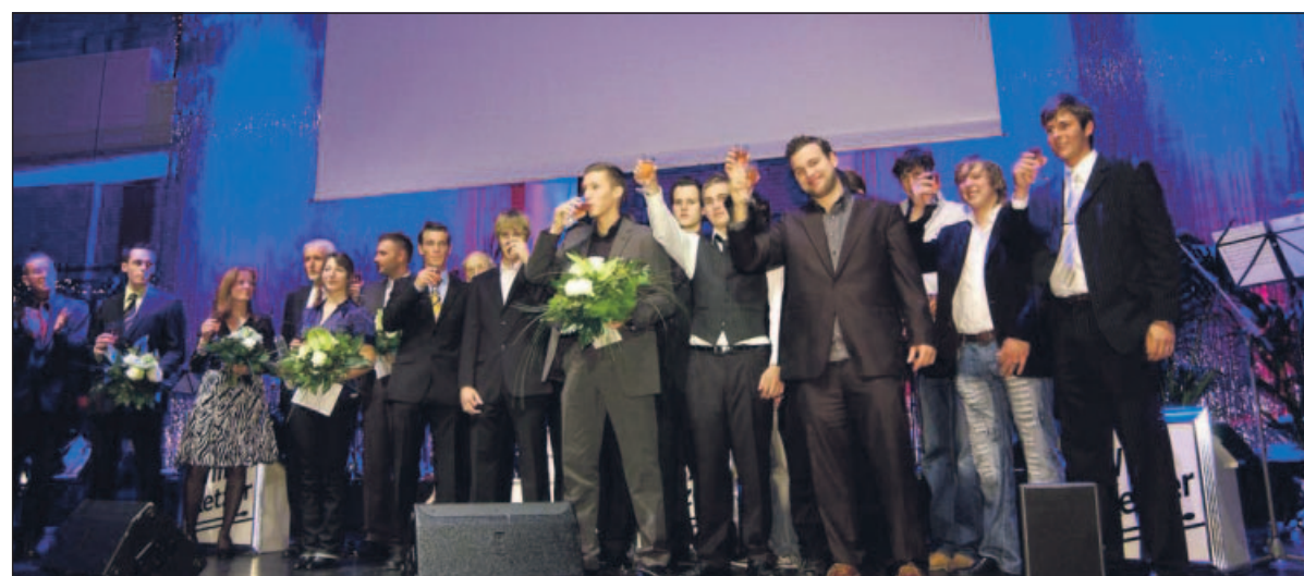
So sehen Sieger aus: Die A-Jugend der TG-Hockeyer wurde zur Mannschaft des Jahres gewählt.